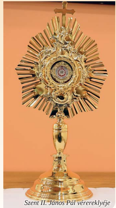
Szent II. János Pál véreereklyéje