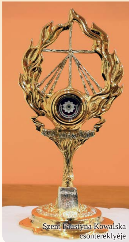
Szent Faustyna Kowalska csonterekllyéje